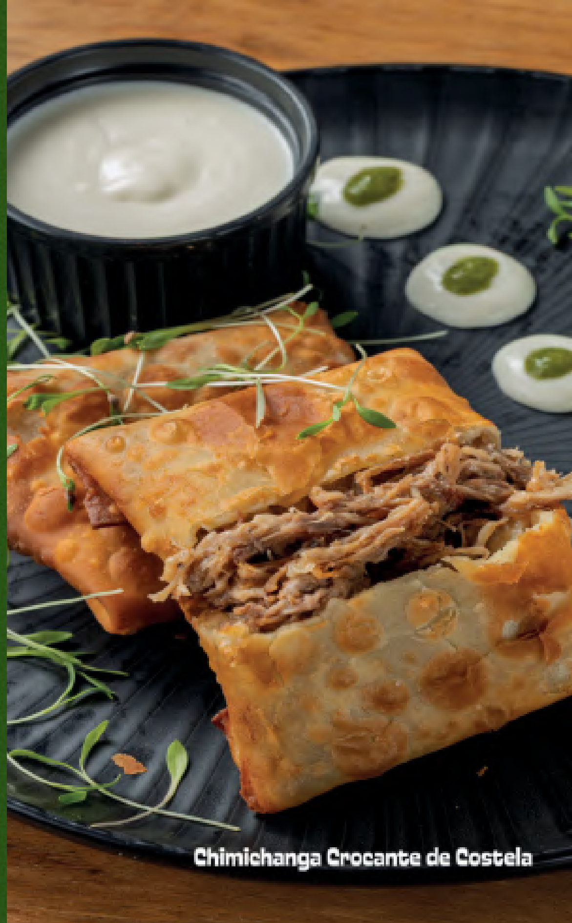
Chimichanga Crocante de Costela