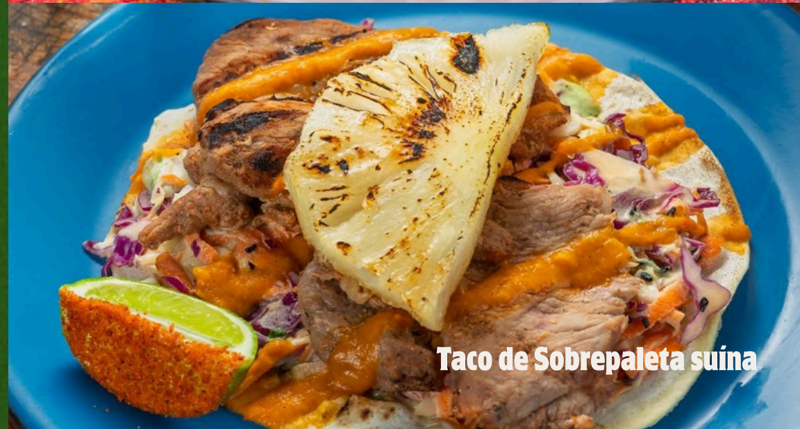
Taco de Sobrepaleta suína