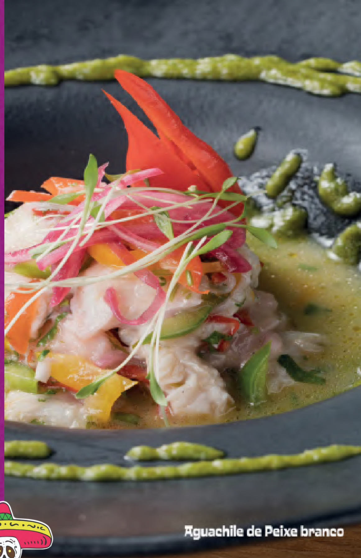
Aguachile de Peixe branco