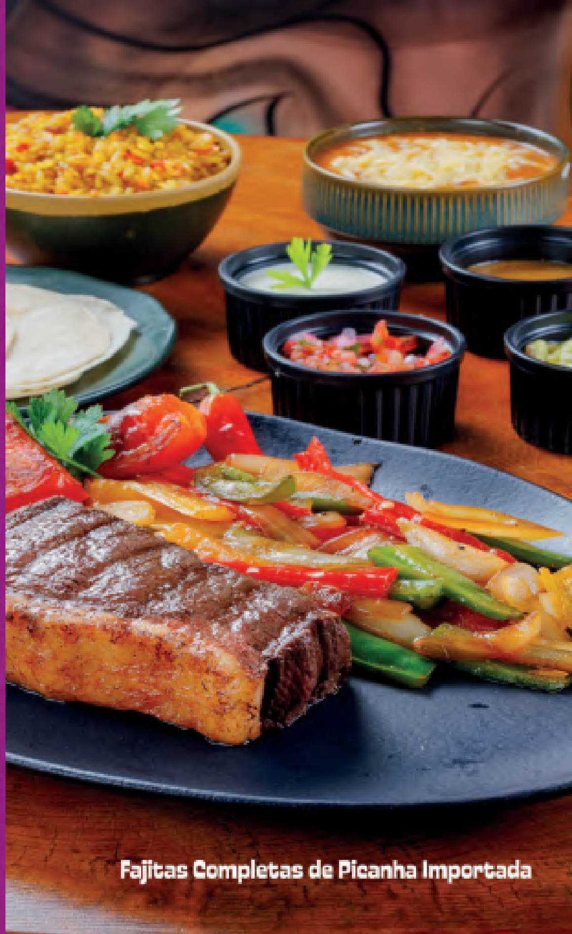
Fajitas Completas de Picanha Importada