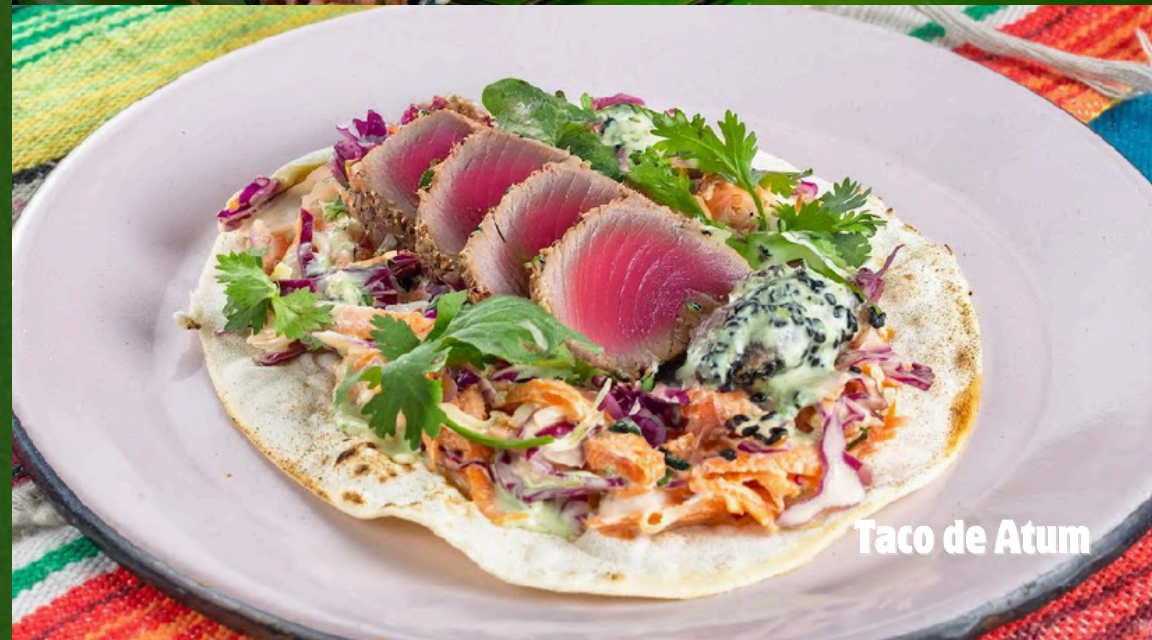
Taco de Atum