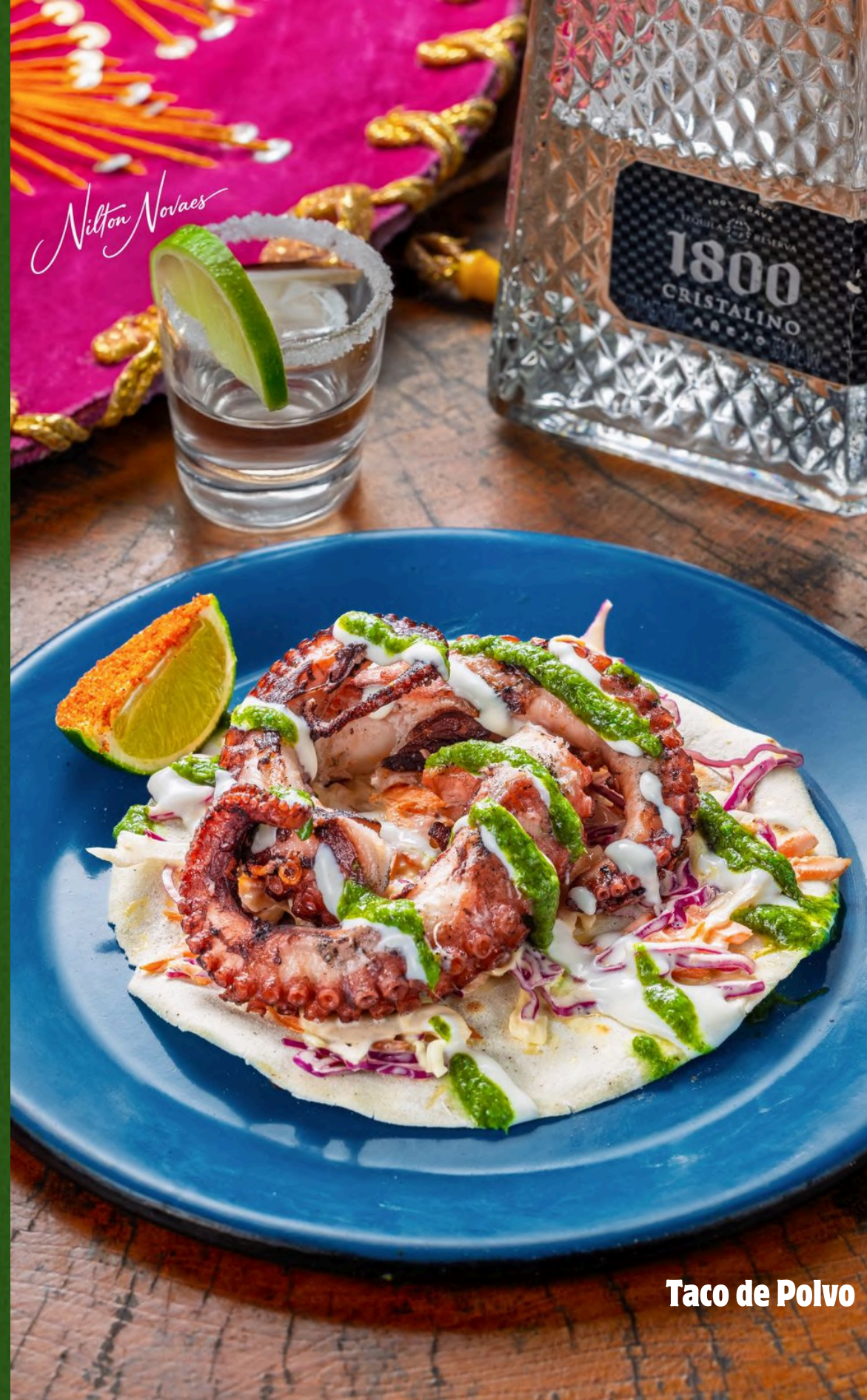
Taco de Polvo