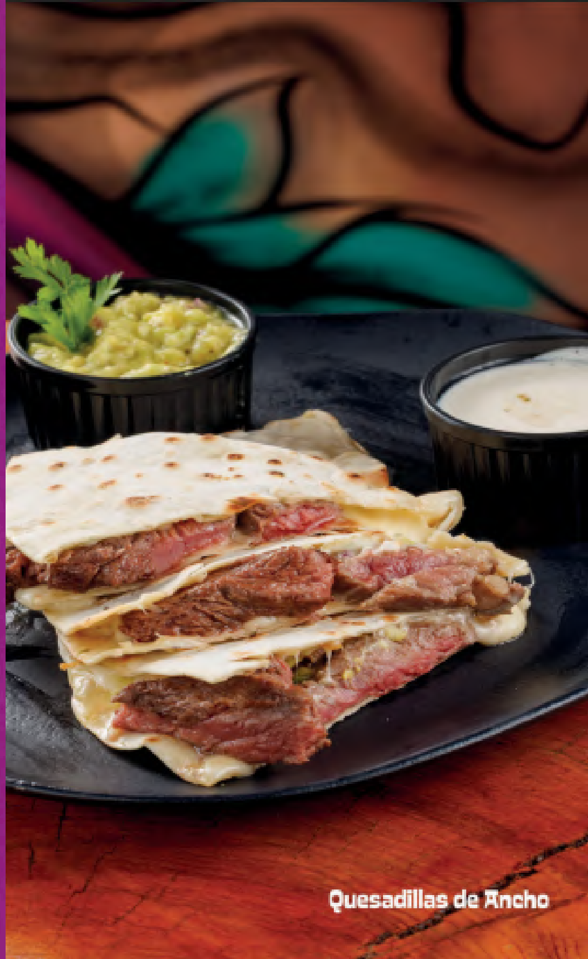
Quesadillas de Ancho