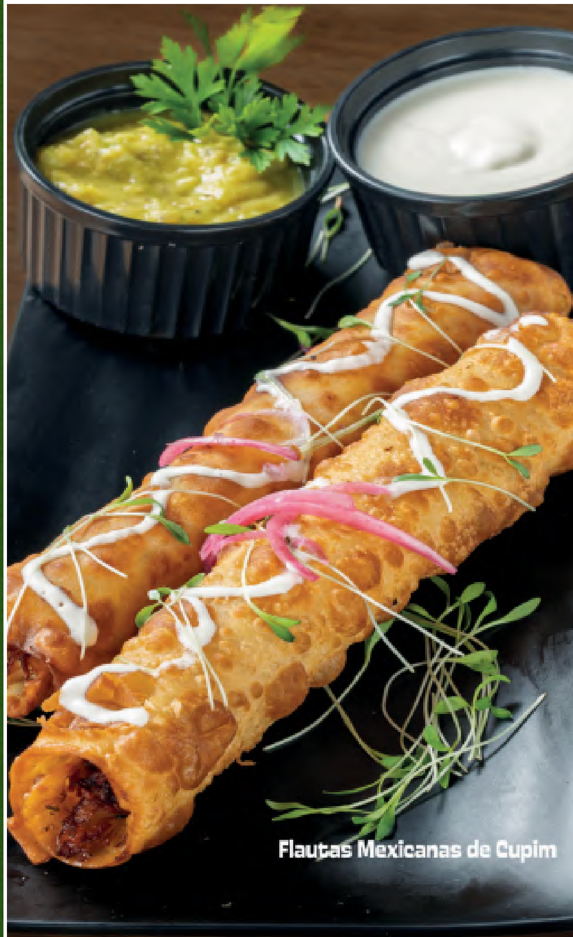
Flautas Mexicanas de Cupim