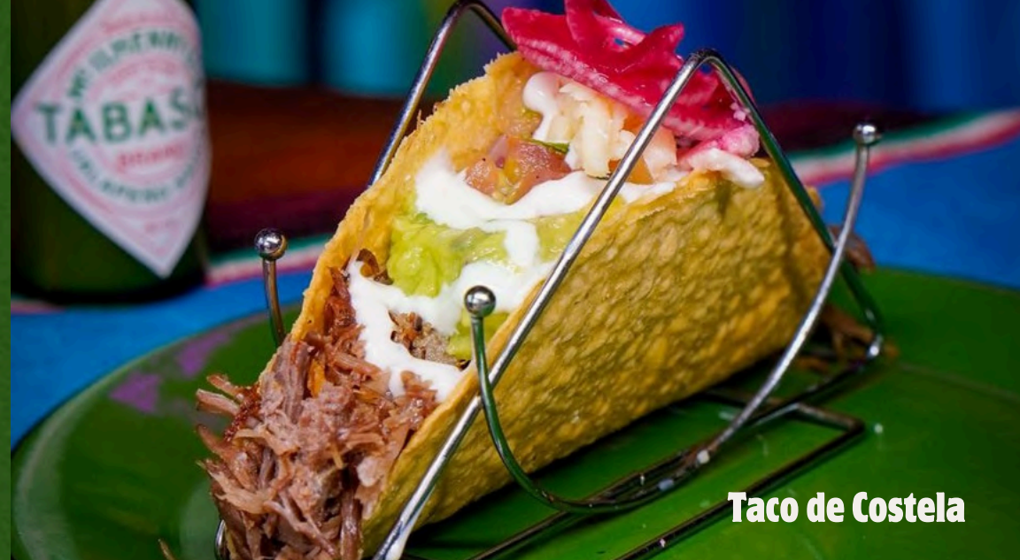
Taco de Costela