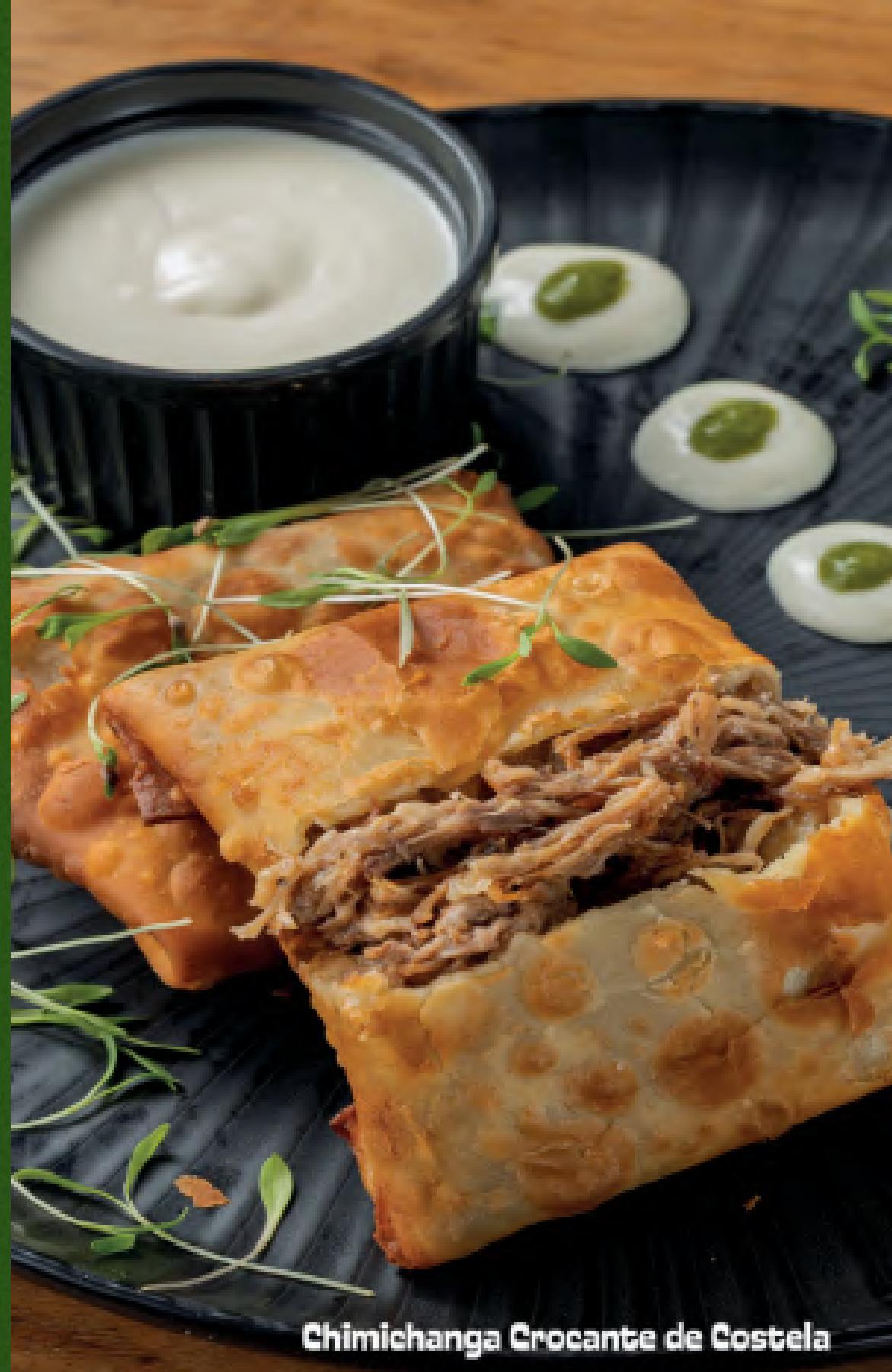
Chimichanga Crocante de Costela