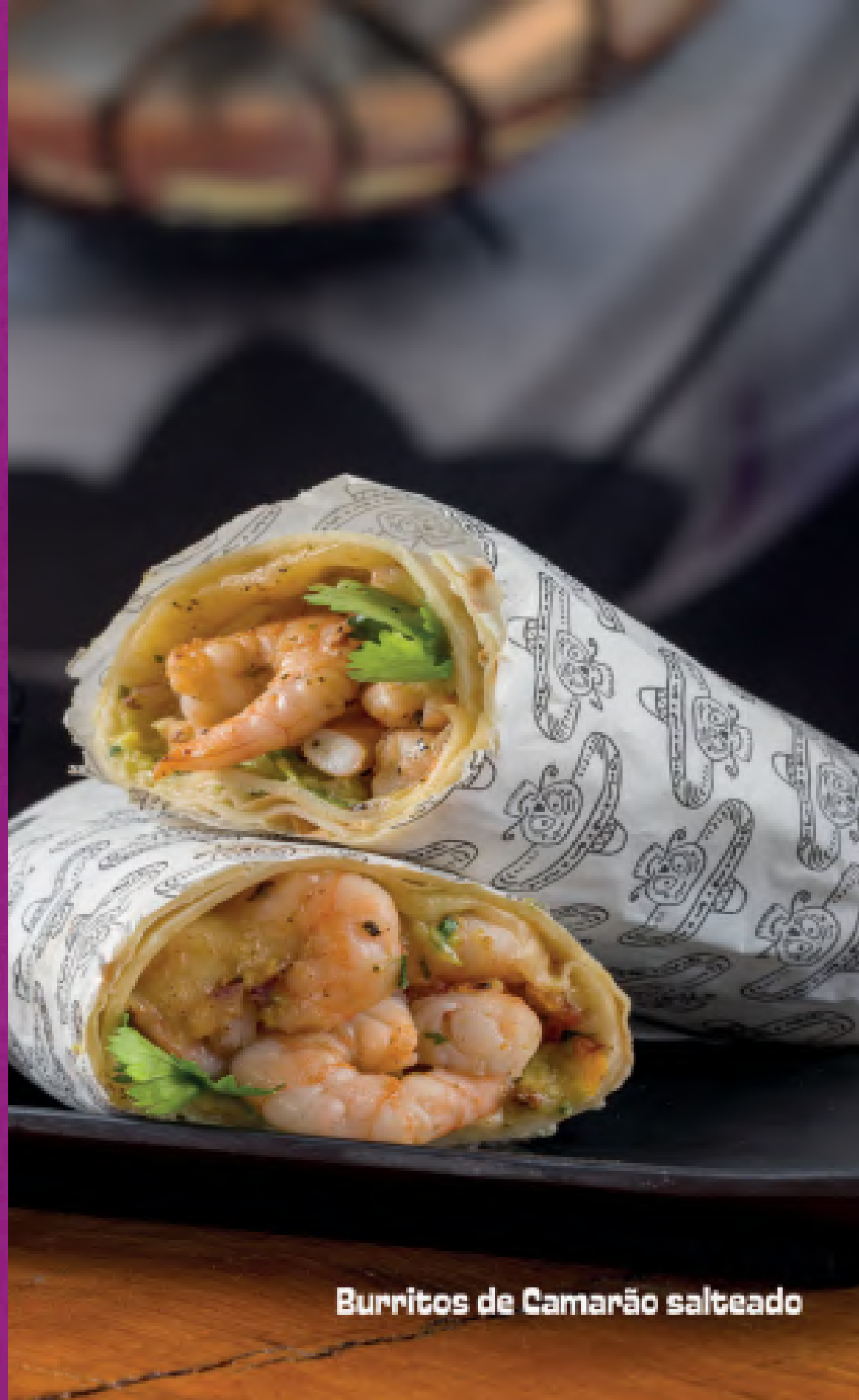
Burritos de Camarão salteado