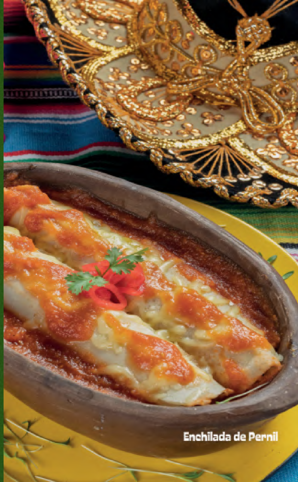
Enchilada de Pernil